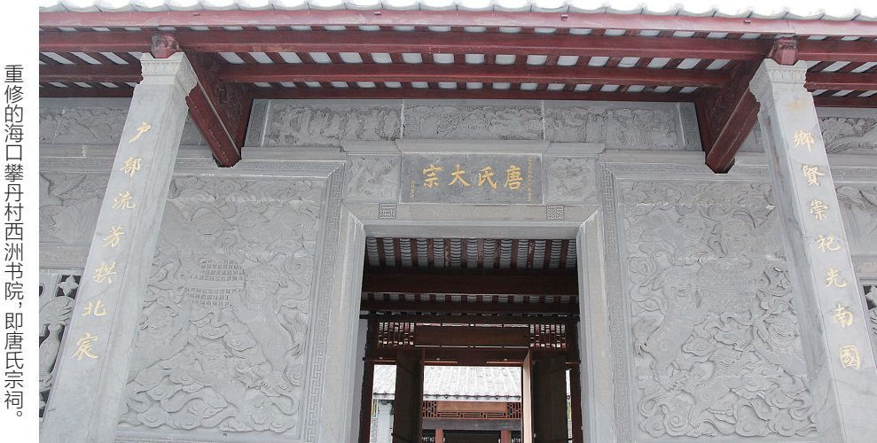
重修的海口攀丹村西洲书院,即唐氏宗祠。

琼州的历史,最辉煌的时期莫过于明代,而位于府城东厢的攀丹唐氏,简直就是那个年代的一个缩影,科举制度下的个人荣辱,各种人物的不同人生际遇和价值取向,都闪耀出夺目的光彩。