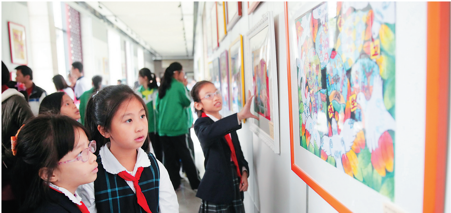
2015年12月31日，海口市中小學生“创建文明卫生城市 共建和谐美好家园”漫画大赛优秀作品展在海南省图书馆举办，吸引不少学生观看。

据了解，本次漫画大赛评比活动得到了全市中小学校的积极响应，经过学校和各区的逐级筛选，共收到参赛作品近千幅，通过专家的认真评选，共评选出了260幅优秀作品。活动旨在海口市中小学掀起“争做文明卫生好公民”活动的高潮，进一步增强中小學生文明卫生意识，不断提高中小學生道德素质。