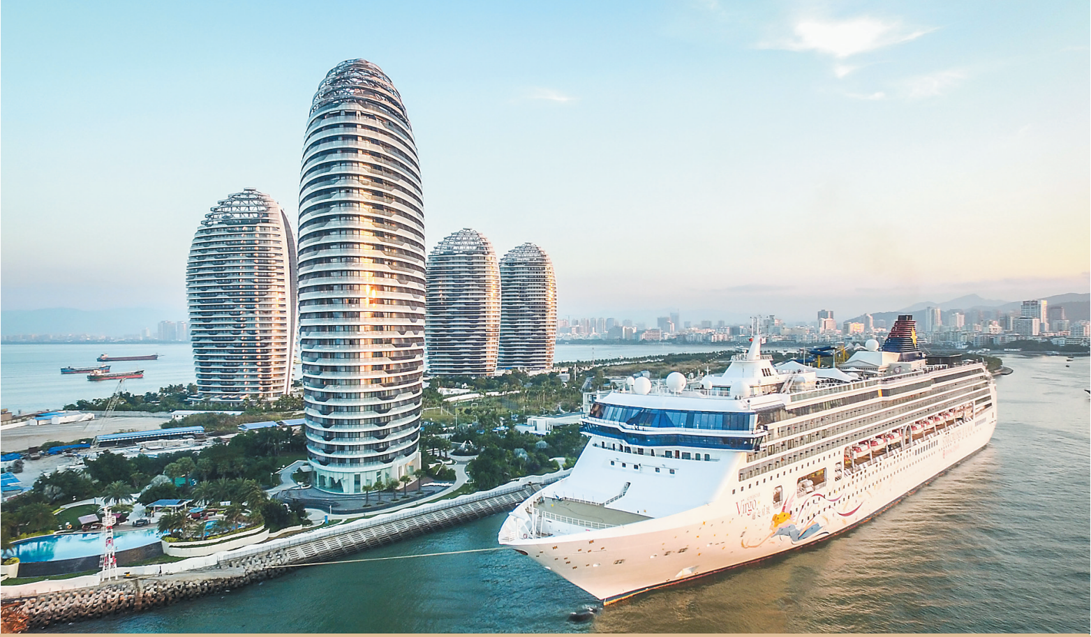
1月7日，丽星邮轮“处女星号”停靠在三亚凤凰岛国际邮轮港码头。

本报三亚1月7日电（记者黄媛艳）今天7时，1860名游客乘坐丽星邮轮旗下的“处女星号”来到三亚凤凰岛国际邮轮港，标志着三亚正式开通2016年母港航线。为庆祝母港航线的开通，三亚特别定制了“首日封”，在邮轮港联检大厅发放给各位游客。