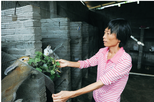
琼山区龙塘镇多贤村村民在喂养兔子。