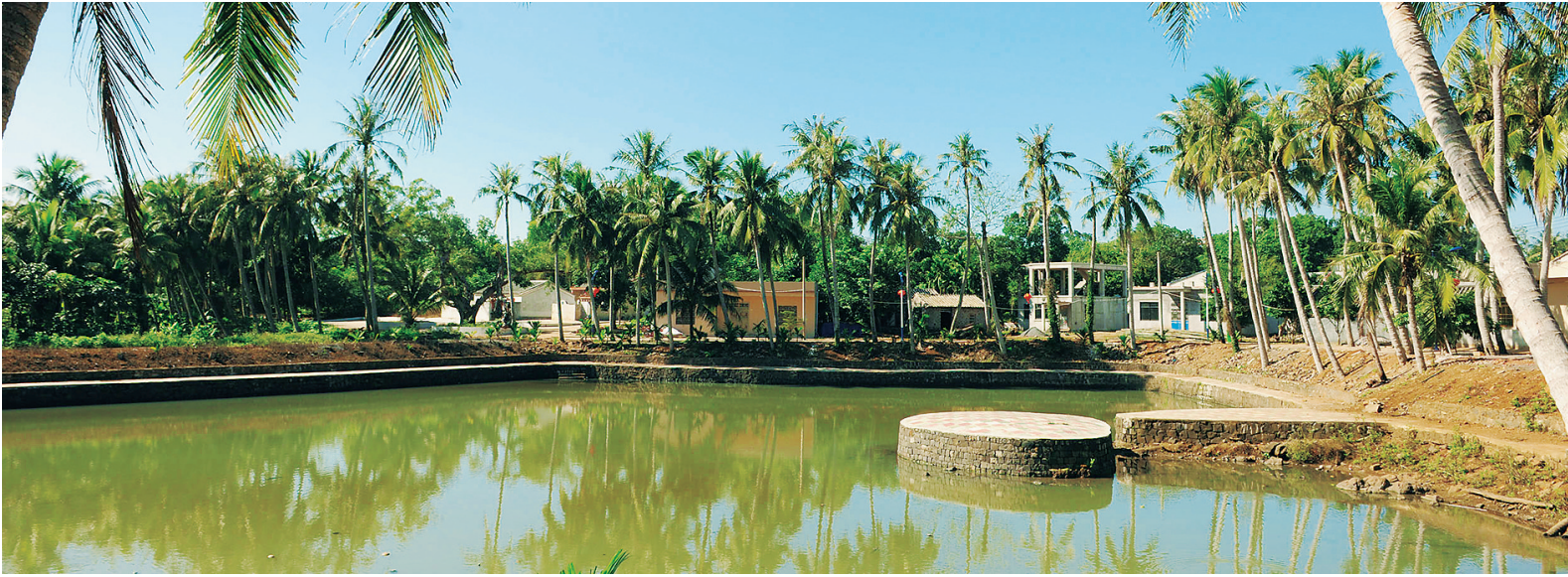
风光秀美的琼山区红旗镇七水一村。