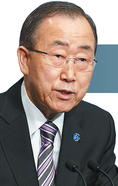
1月6日，在美国纽约联合国总部，联合国秘书长潘基文向记者发表讲话。