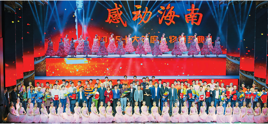
「感动海南」十大年度人物颁奖典礼。