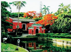
五公祠位于海口市。自北宋大文豪苏东坡于绍圣四年（1097）被贬来琼，借寓金粟庵（今五公祠内）留存遗迹以来，宋、元、明、清及民国历朝不断在