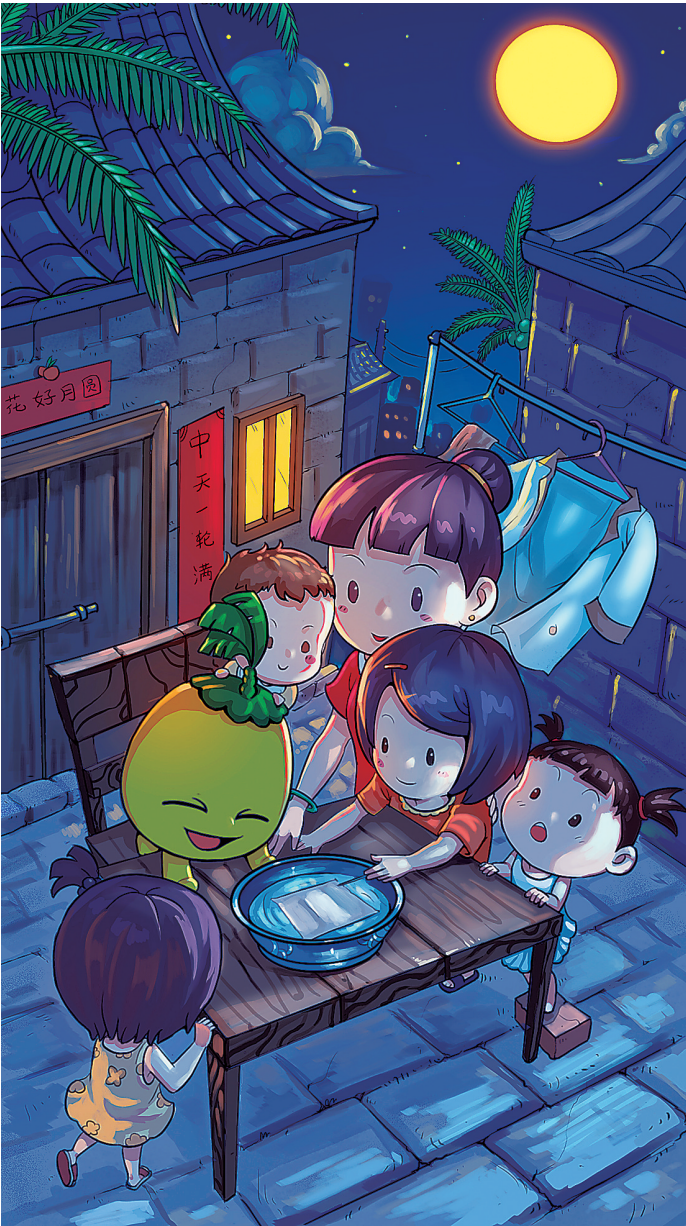
波波椰反映海南中秋节民俗是卡通画。

“海南80后”虽不是语言类微信公众号，但在其发布的多条历史信息中，与海南方言有关的所占比重达到十之五六——马来西亚琼侨麦英演唱的海南话歌曲《一家人》催人泪下，《海南省居民常用的10种方言》令人惊奇，《海南妹子用海南话+英语介绍五指山》又让人忍俊不禁。