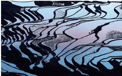
云南哈尼梯田美如画

针对此事,昆明市卫生学校还向学生、学生家长及社会公开道歉,表示将深入开展职业道德教育,严格整治师德师风。据武绍宏介绍,学生家长已接受学校道歉并对学校的处理结果表示满意。