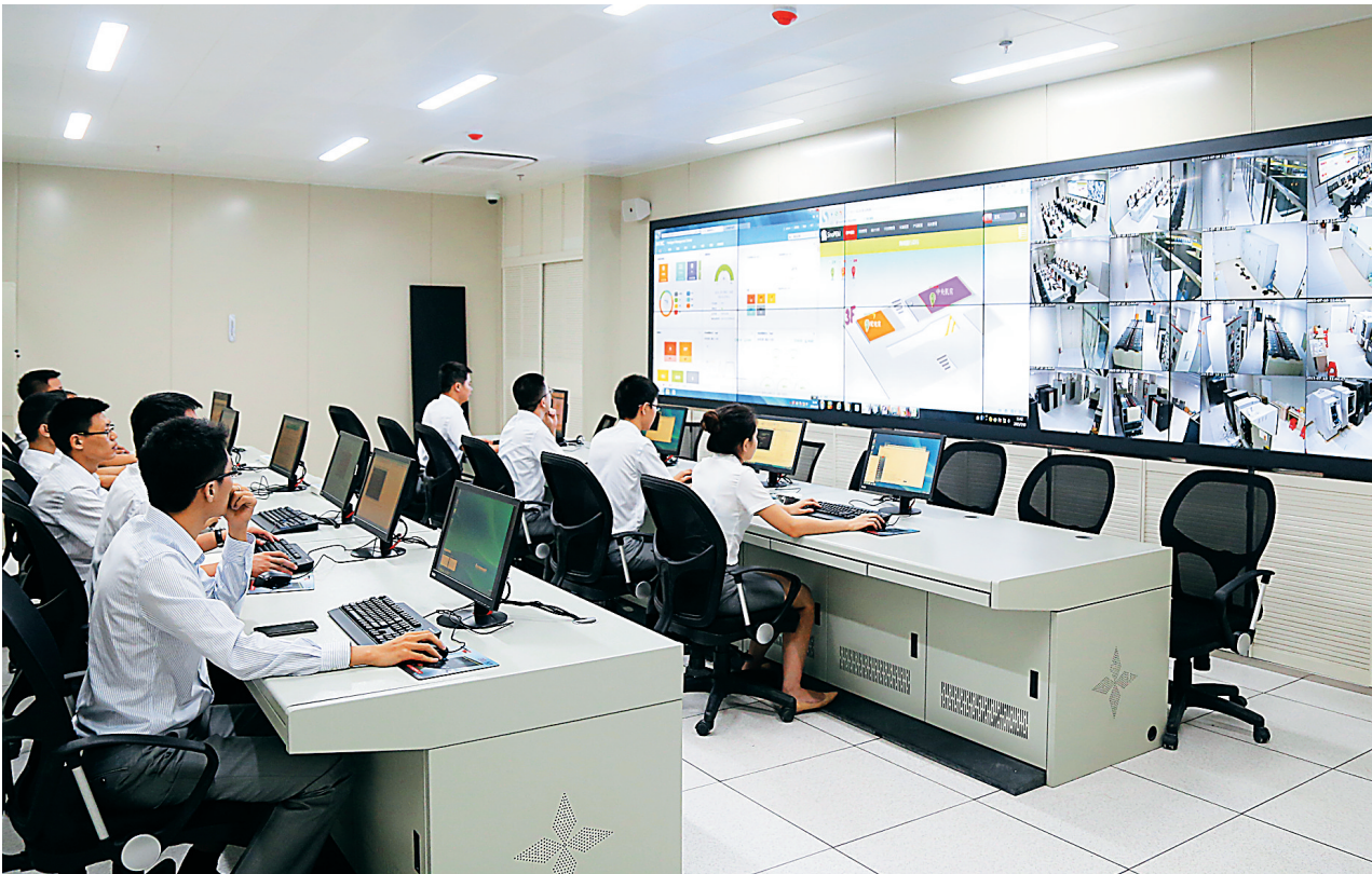
海南银行数据中心监控大厅。