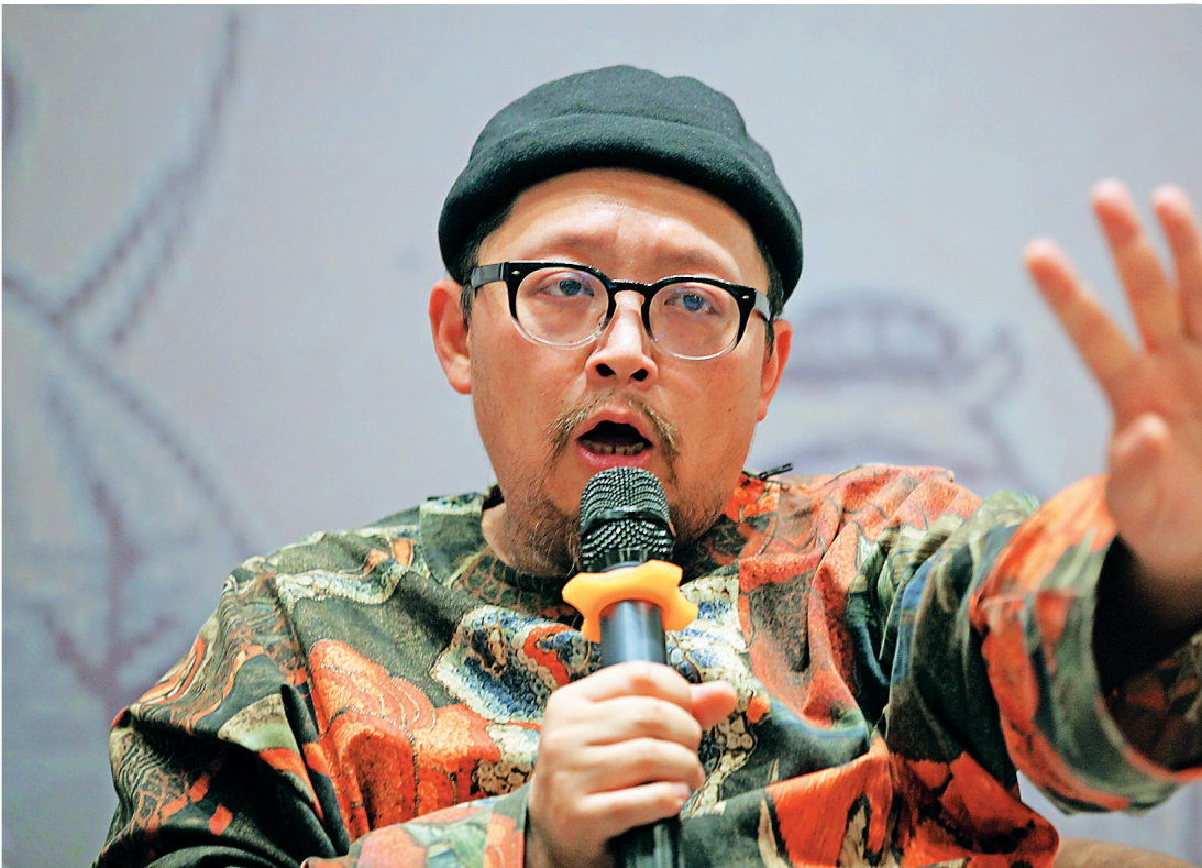
史航携《野生动物在长春》与读者分享并签售。

2016年1月16日,周六的海口知和行书局里,挤满了熙熙攘攘的读者,著名编剧史航正在这里签售他的新书《野生动物在长春》。这个身材微胖,头戴一顶呢绒小帽、鼻梁上架着一副圆圆的黑框眼镜的中年男人,是第一次来海口,热情而又庄重地在读者们手中新书扉页上签上自己的名字。