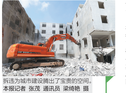
拆违为城市建设腾出了宝贵的空间。

曾经,2015年的海口棚户区改造因为速度滞后,遭到省里点名,到了年末却因为超额完成任务而获得省政府颁发的棚改单月大奖;2015年年初海口确定的年度拆违任务为100万平方米,到年末拆违却超额266.4%。 棚改、拆违,都是号称“天下最难”的工作,是最难啃的“硬骨头”。为什么去年在海口,这两项工作却发生了“大逆转”?其关键因素在于,海口建立了以“双创”为重心的工作体制,把项目建设中“最难啃的骨头”纳入到例行的“双创”工作领导小组全体会议议程中,通过“双创”模式来加以突破。 去年7月31日,海口召开“双创”动员大会后,在省委常委、海口市委书记孙新阳的提议下,海口市建立了几乎每周一次的“双创”工作领导小组全体会议制度,“双创”工作领导小组四组长和其他成员,即海口市四套班子的主要领导和其他市领导,以及各区各部门的负责人都会一一与会。每次会议上,“双创”指挥部都会将“双创”有关的各项工作一一纳入议程,通报进展,集思广益,及时决策,解决难题,鞭策后进。一次次“双创”全会开下来,一个个“双创”难题都迎刃而解,海口“双创”工作也取得了令人瞩目的巨大成绩。 看到以“双创”为重心的工作体制的强大力量后,市委市政府将更多的全市经济社会发展中的疑难重点工作纳入“双创”全会议程中,取得了意想不到的良好效果。 违法建筑整治自“双创”工作一启动就被纳入“双创”工作范围。“双创”伊始,海口市就及时调整了打违的工作目标,确定在年初任务量的基础上增加140万平方米,即全年拆违不少于240万平方米,而到年末却拆违达到366.4万平方米。