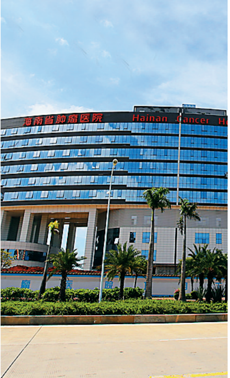
重点工程海南省肿瘤医院建成开业。

通过大力推动设立政府投资基金、发展PPP模式、政保贷模式和融资担保等方式,不断化解海口跨越式发展所需巨量资金的困难。 去年11月18日,被誉为海口“解渴工程”的南渡江引水工程开工。这是国家172个节水供水重大水利工程项目之一,项目总投资达到36.2亿元。 “为了更好地融资和推进项目建设,市里决定采用政府和社会资本合作(即PPP)模式。”市水务局规划处处长陈挺雄说,为此海口市通过公开招标选择了葛洲坝集团,这是一家有强大资本实力、丰富项目建设管理和运营管理经验的企业。 去年海口积极推进PPP模式,建立了PPP管理中心,覆盖交通、环保、能源、文教等重点民生领域,总投资超700亿元的44个项目被筛选入项目库,成功签约落地3个项目,还积极探索通过PPP模式化解政府存量债务、盘活存量资产的路径,走出了一条推动存量项目PPP的新模式。 随着经济下行压力的加大,要扛起全省发展领头羊的责任担当,海口在经济建设方面的责任更加重大,投资仍将是海口未来拉动经济的关键。去年海