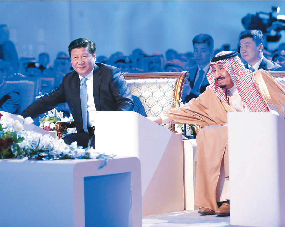
1月20日，国家主席习近平和沙特阿拉伯国王萨勒曼共同出席中沙延布炼厂投产启动仪式。这是习近平和萨勒曼国王共同按下启动键，延布炼厂项目正式投产启动。

新华社利雅得1月20日电（记者王波）20日，国家主席习近平和沙特阿拉伯国王萨勒曼共同出席中沙延布炼厂投产启动仪式。