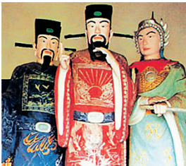
陈尧叟、陈尧佐、陈尧咨三兄弟塑像。

天禧元年(1017年)，陈尧叟病危，被诏准回京，不久辞别人世，享年57岁。为纪念一代重臣陈尧叟，真宗特废朝两日，以示哀悼，赠侍中，谥号文忠。同时，朝廷特赐其长子师古为进士出身，录其孙知言、知章为将作监主簿。史书记载：“尧叟伟姿貌，强力，奏对明辨，多任知数。久典机密，军马之籍，悉能周记。所著《请盟录》三集二十卷。”(《宋史·陈尧叟传》)时至今日，位于四川南部县大桥镇的“三陈故里”以及阆中的“状元洞”等都是人们纪念陈尧叟兄弟的场所。后世陈氏家族也以“三尧堂”作为对辉煌先祖的怀念。📖