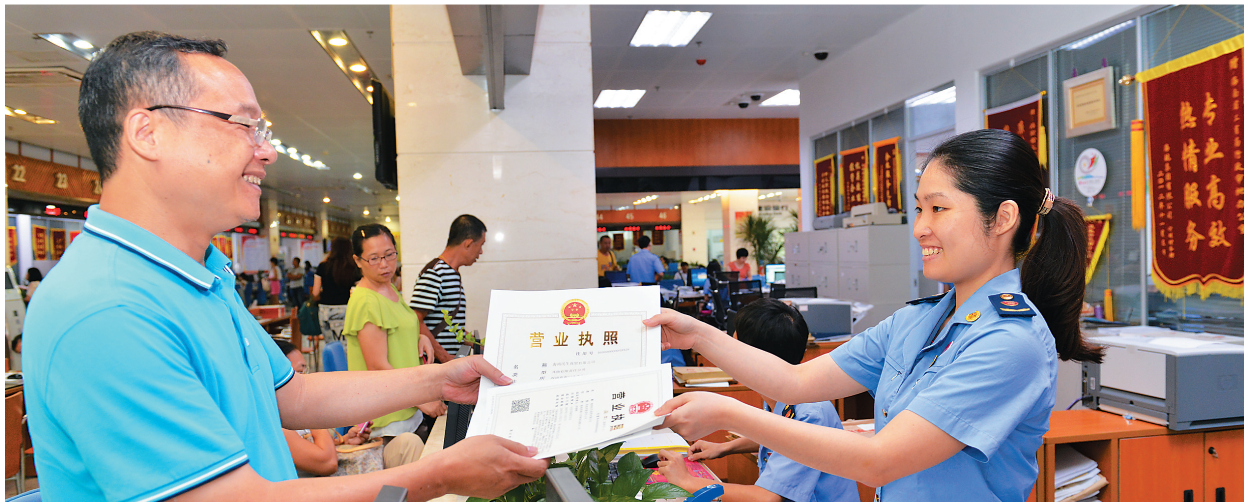
海南工商局积极探索工商登记便利化,率先实行三级注册官制度,为企业注册登记提速。

2015年2月26日,海南省工商局在全国率先撤销审批办,实现了从审批准入到注册备案的华丽转身。海南工商成为全国首个撤销审批办的政府部门。这是全国商事制度改革的一个重大突破,是对传统审批模式的历史性颠覆。从此,市场主体办理营业执照不再需要经过层层审批,一个简单的注册登记就可以拿到经济市场的“入门券”,市场准入的“篱笆墙”将彻底成为历史。