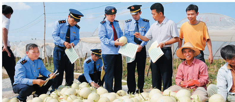
工商人员深入田间地头,扶持企业做强做大。

现在全省任何一个工商窗口都是免费办理工商业务,一年能为全省企业和个体经营者节省 5000 多万元费用