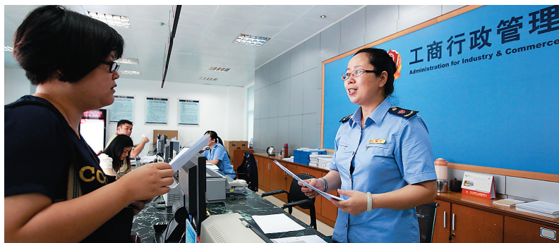
海口市龙华区工商局办事服务中心,工作人员正在耐心、细心为群众办理企业注册登记等业务。