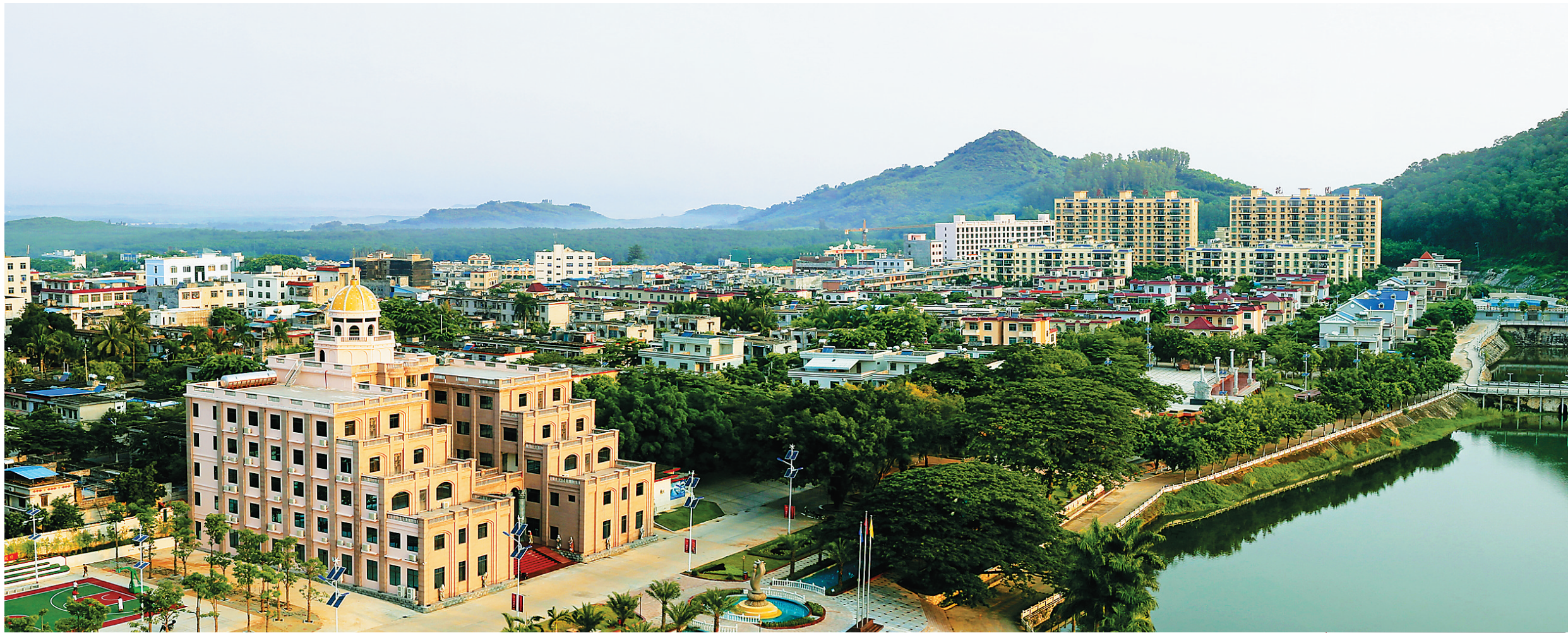
海南农垦八一总场处处呈现城美人兴的气象。