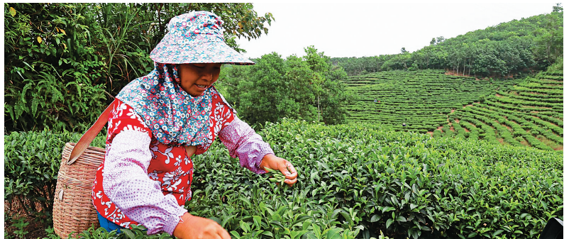
位于琼中黎族苗族自治县境内的乌石农场33队茶园,茶农正在采摘茶叶。