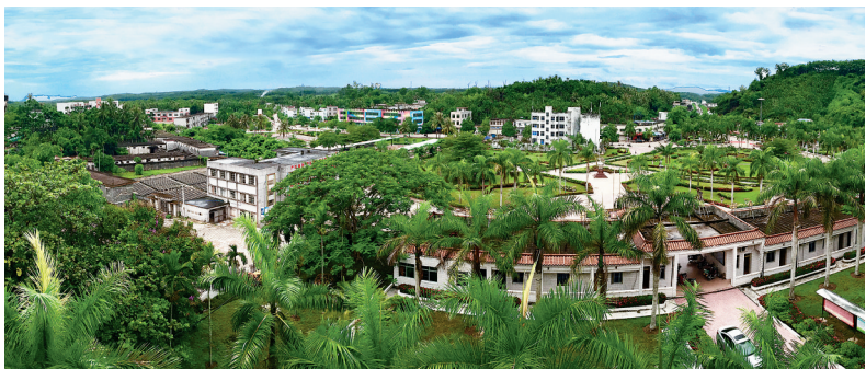
绿意盎然,环境优美的国营东太农场场部。

回眸发轫于2008年海南农垦管理体制改革的,其堪称海南农垦历史上涉及面最广、层次最深及最为彻底的一次改革。特别是近五年来,在党中央和国务院的关心和支持下,在省委、省政府的坚强领导下,海南农垦改革紧紧围绕“三融入”目标扎实有序推进,先后出台实施了一系列重大改革措施,取得了阶段性成果。体制改革既涤荡了百万农垦人思想和观念,又极大地激活了海南农垦。