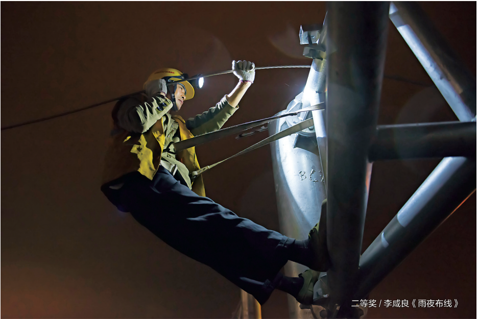
二等奖 / 李成良《雨夜布线》