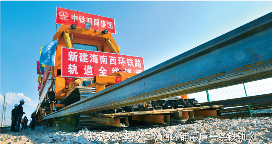
优秀奖 / 李汉仁《西环铺最后一块铁轨》