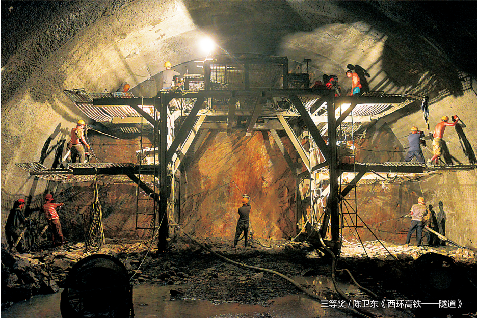
三等奖 / 陈卫东《西环高铁——隧道》