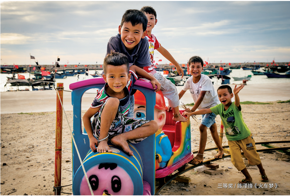
三等奖 / 陈泽锋《火车梦》