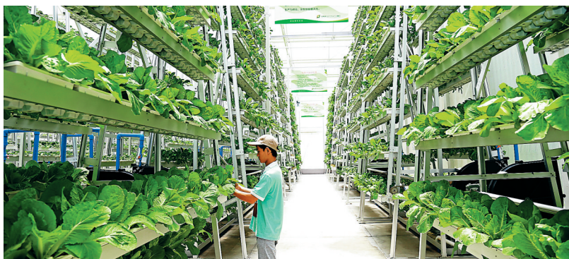
陵水现代农业示范基地,一名工作人员在管理蔬菜垂直种植区,这些安全、新鲜蔬菜将销往各大超市。