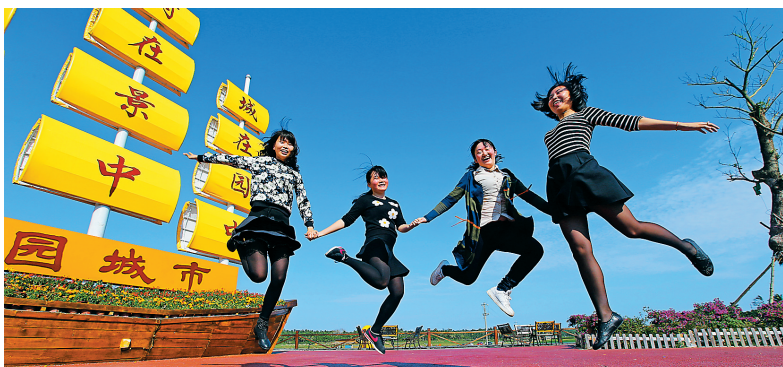
游客在琼海市龙寿洋国家农业公园里尽情欢跳,享受假期的休闲时光。