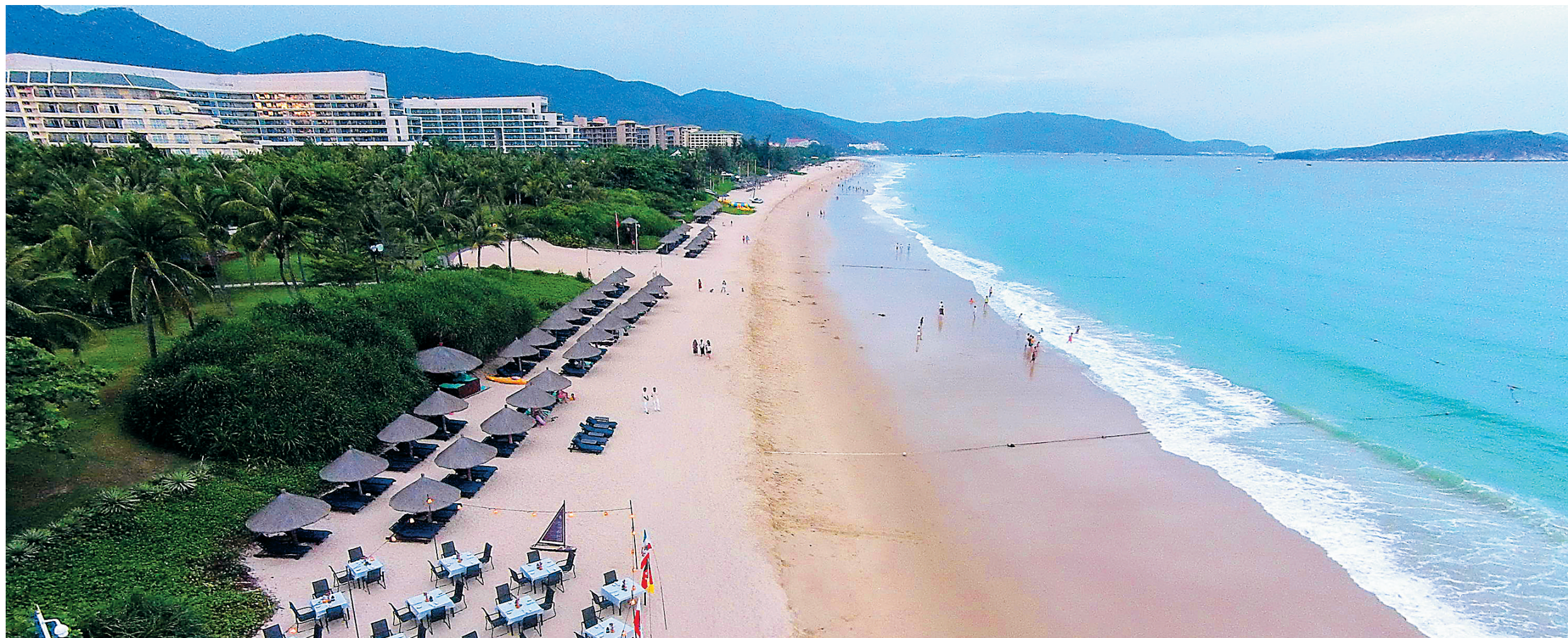
三亚亚龙湾美丽岸线吸引了许多旅游经济综合体入驻。