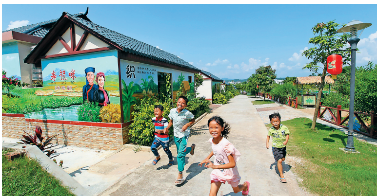
水泥路通村入户,改变了百姓的生活。图为在美丽苗寨琼海苗绣园村,村里的孩子在环村路开心奔跑。