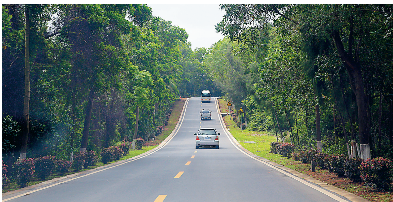
琼海博鳌通往漳门的乡村公路。