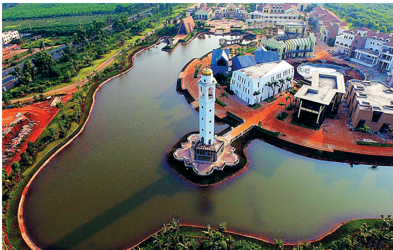
雪茄风情小镇为儋州乃至海南旅游业发展注入新元素。