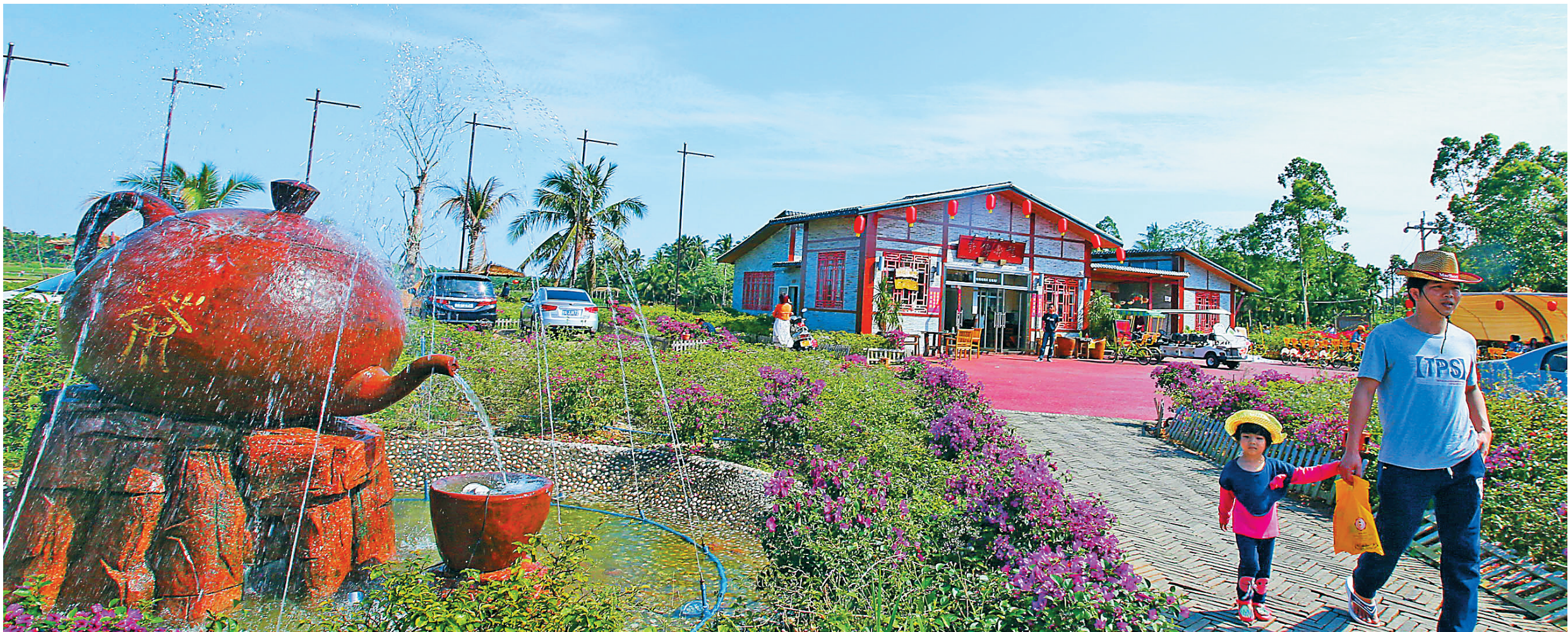
琼海三不一就城镇化模式成全国城镇化建设新模式。