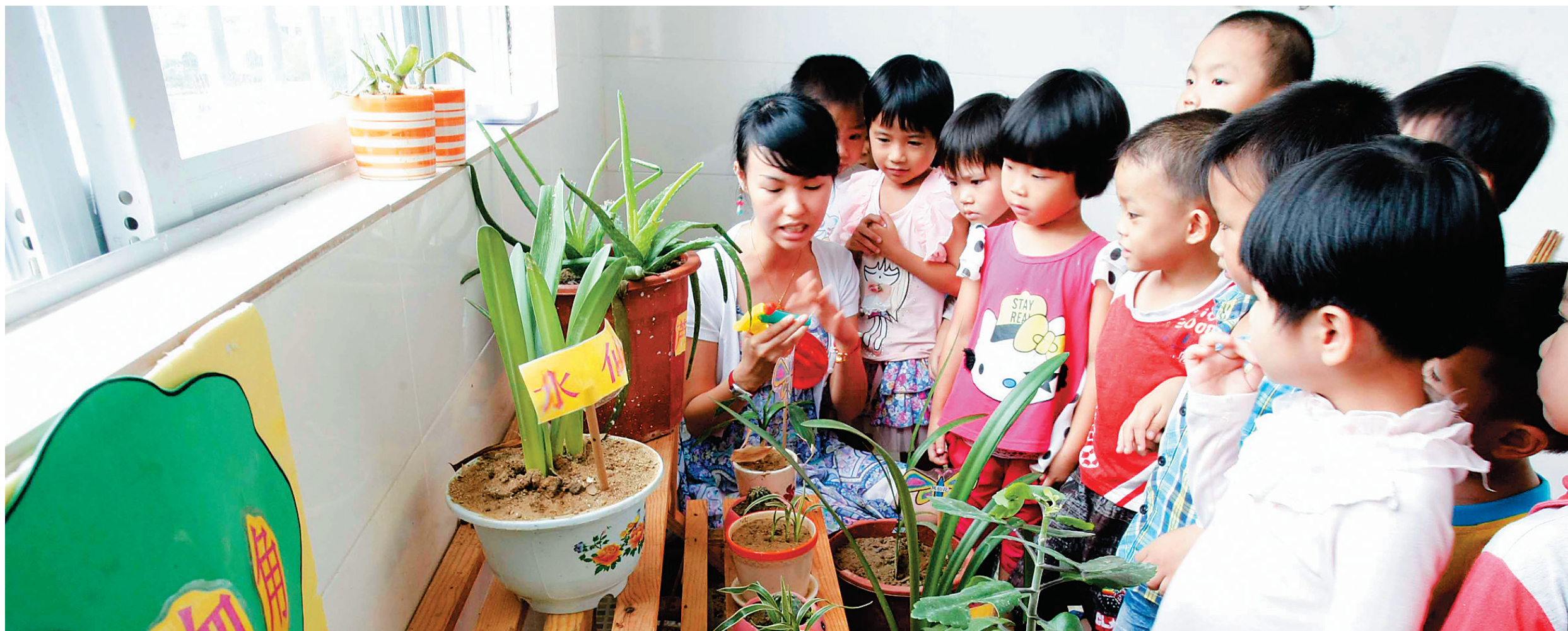
琼中黎族苗族自治县湾岭镇中心幼儿园的植物角深受孩子喜欢。