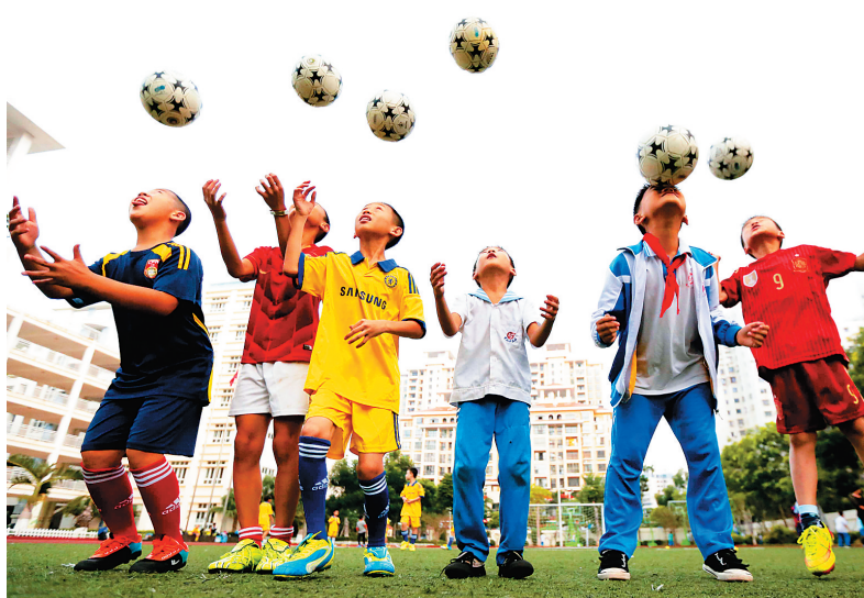
海南大力发展青少年校园足球运动。

“十二五”期间,我省学前教育、义务教育、普通高中教育、特殊教育、民族教育全面发展,坚持做好立德树人的根本任务,丰富多彩的体育、艺术活动活跃中小校园。同时,我省全面加强教师队伍建设,为“提高教育质量、促进教育公平”保驾护航。