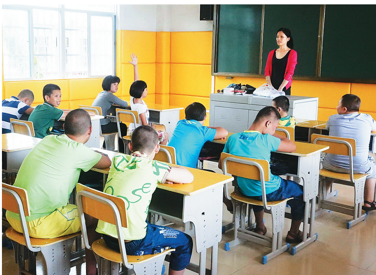
三亚市特殊教育学校2014年正式开学。