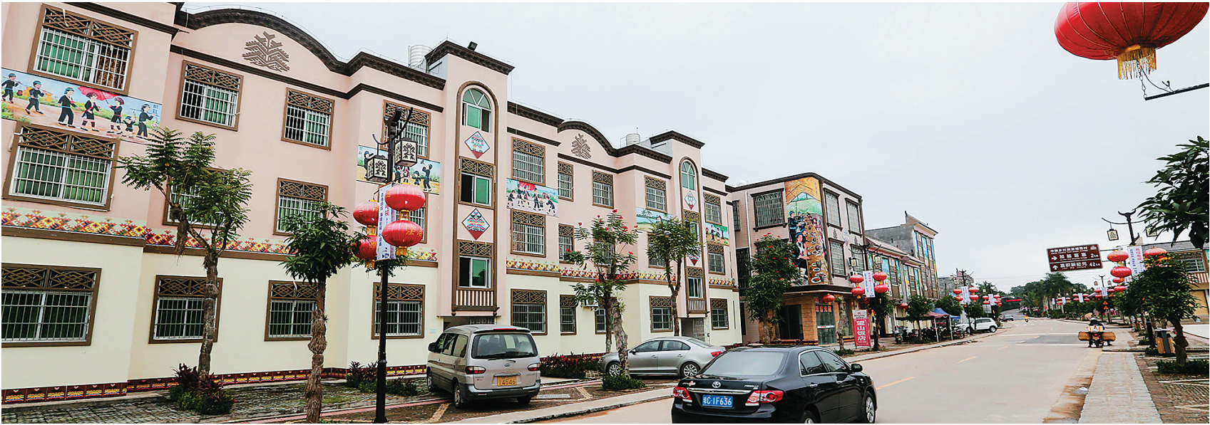
琼海会山镇打造成民族特色浓郁的风情小镇。