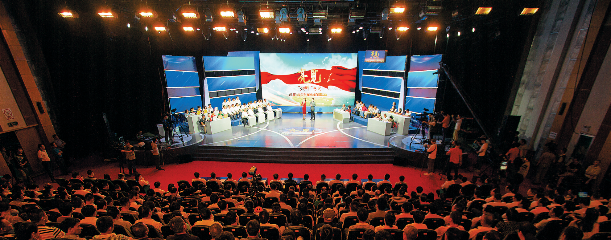
2015年12月20日,海口广播电视台《亮见》节目直播现场。