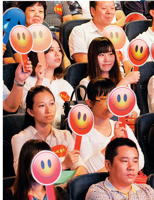
《亮见》直播现场市民代表。

现如今,《亮见》曝光问题涉及的责任人已有131人被严肃问责,落实整改问题、“马上就办”已成海口党政机关新风气。