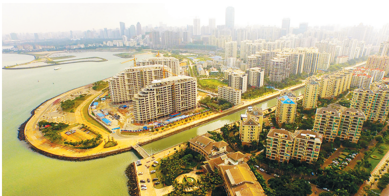
海口湾日新月异,成为市民游客休闲娱乐的好去处。

“十二五”时期,是海口进入国际旅游岛建设新时期的第一个五年,也是海口发展史上极其重要的五年。