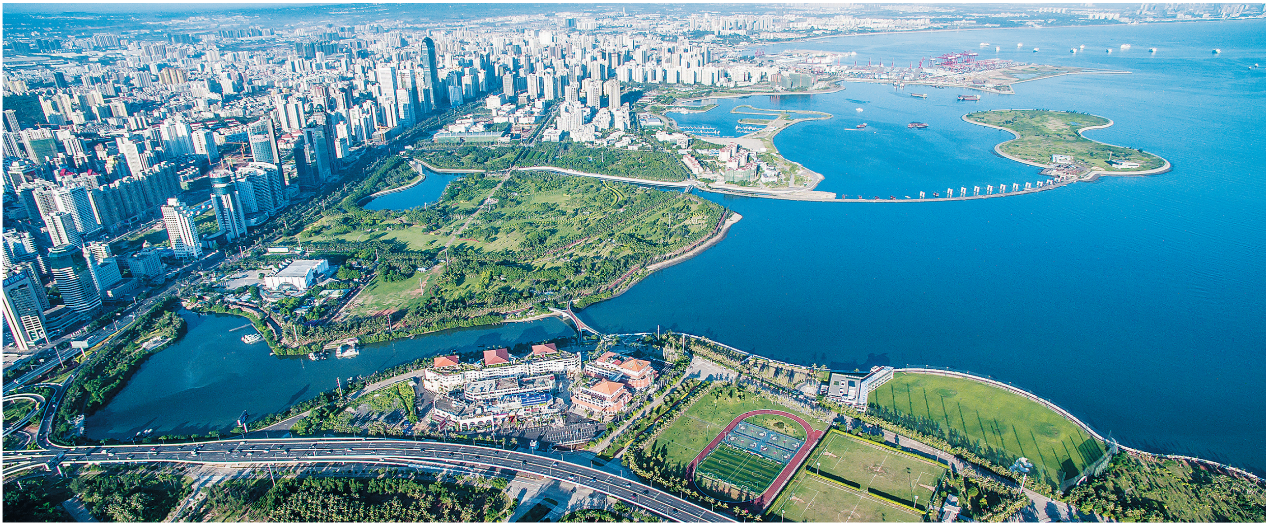
海口滨海公园、世纪公园、万绿园三园合一。

犹记得2010年,海口全市生产总值(GDP)刚超过500亿元,仅仅4年光阴,一组“千、百、万”的数据振奋人心。面对全球性经济低迷与两次强台风的正面袭击,海口经济依然保持了较快增长,实现了“千百万”的跨越:2014年海口市全市生产总值(GDP)1005.51亿元,地方公共财政预算收入100.12亿元,农村居民人均可支配收入10630元。