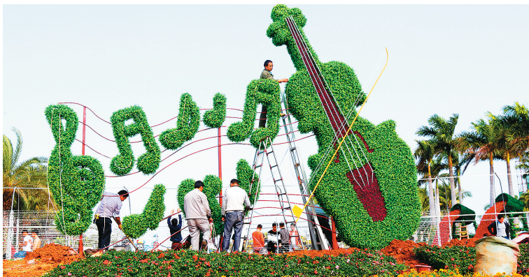
海口市海甸岛美丽沙广场装扮得漂漂亮亮,吸引了众多游客。