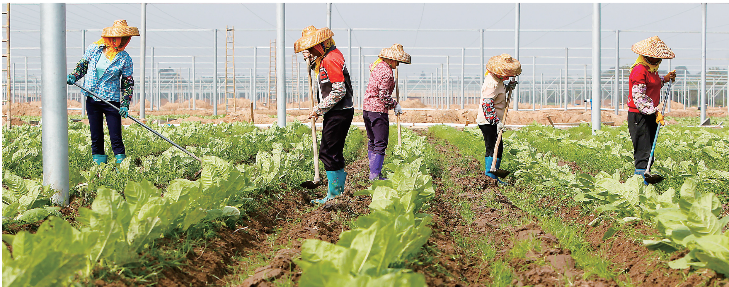
「接二连三」的雪茄项目促进儋州三次产业融合发展。图为工人们正在儋州光村雪茄烟叶种植示范基地除草。