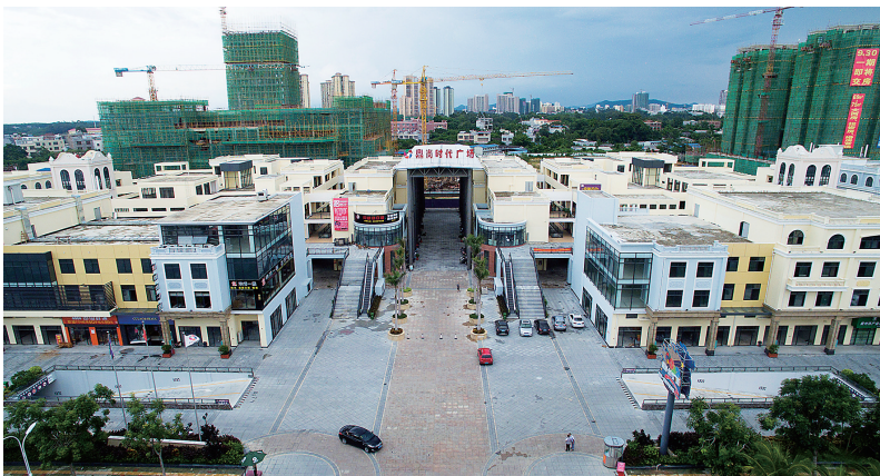
儋州着力建设互联网信息产业基地，图为那大互联网产业城。