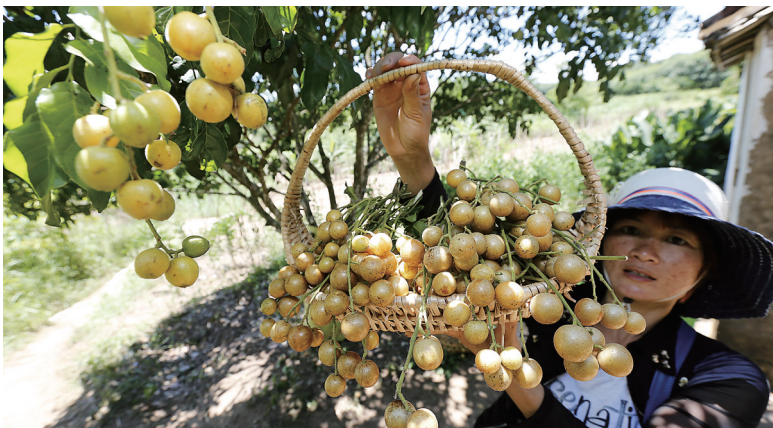
如今，儋州黄皮已由以前的路边产品，摇身变为十分紧俏的品牌产品。

那大互联网产业城坐落于儋州的鼎尚时代广场。海南鼎尚商业管理有限公司副总经理徐飞表示，这里将为“那大互联网产业城”建设提供足够宽广的平台。在已竣工1万平方米一期工程平台基础上，二期工程平台面积为7万平方米，2016年3月可望竣工。