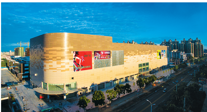
儋州城市功能日趋完善。图为将商业、娱乐、休闲、商务、购物、居住融合为一体的夏日国际广场。

长高长大的那大城区,城市功能日趋完善。海南西部中心医院建成运行,提升了那大城区医疗卫生条件。投资均达10亿元的鼎尚时代广场、夏日国际商业广场已开业运行,投资3.8亿元的海南西部家居建材博览中心即将开业。这些新兴商圈,与周边楼市发展相得益彰。