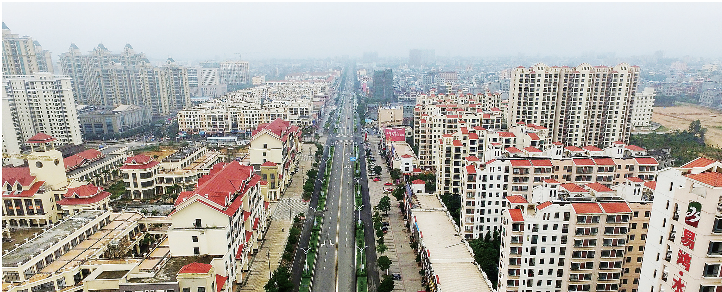
长高长大的那大城区,城市功能日趋完善。图为儋州城区建设新面貌。