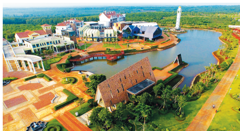
“十二五”期间,儋州着力打造一批风情小镇。图为光村雪茄风情小镇的迷人风光。

谓之更远,是因为白马井镇与排浦镇部分地区,通过两条平行大道连成滨海新区,该新区总面积59平方公里。可以预见,此举将推动两镇成为“经济共同体”。