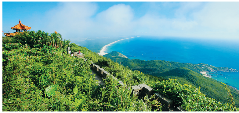
随着文昌旅游的不断发，月亮湾也成为如今受游客喜爱的景点。图为从铜鼓岭景区俯瞰月亮湾。