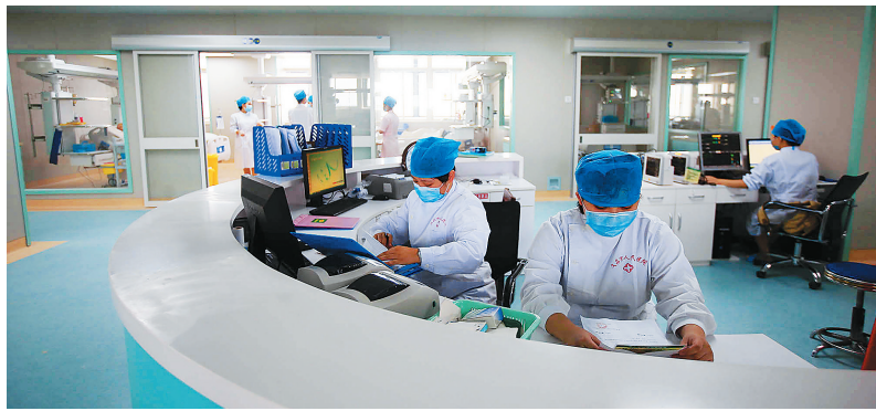
“十二五”期间，文昌市一直把民生放在发展首位。图为新建成的文昌市人民医院，为文昌人民提供了更好医疗保障。