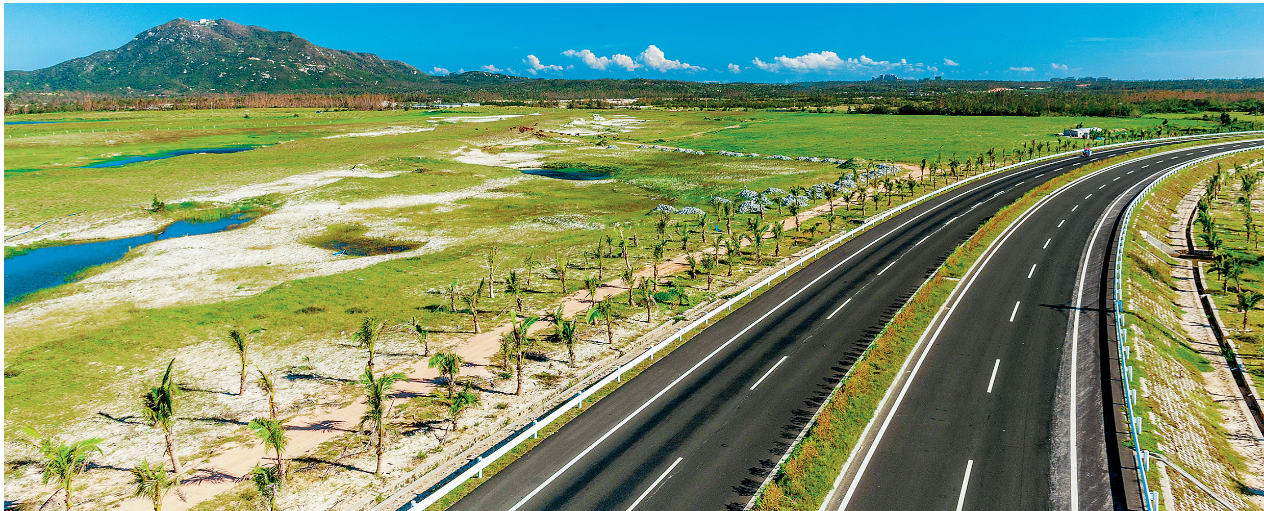
「十二五」期间，文昌的路网愈加完善。图为文昌滨海旅游公路。