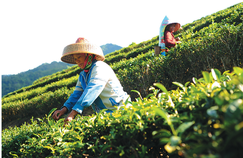
五指山大力发展茶叶、热带花卉等特色农业。图为五指山水满乡椰仙茶场,妇女们采茶忙。

投入 3.02亿元 ,完成 73 家国企改革,安置职工 4751 人,盘活了存量资产