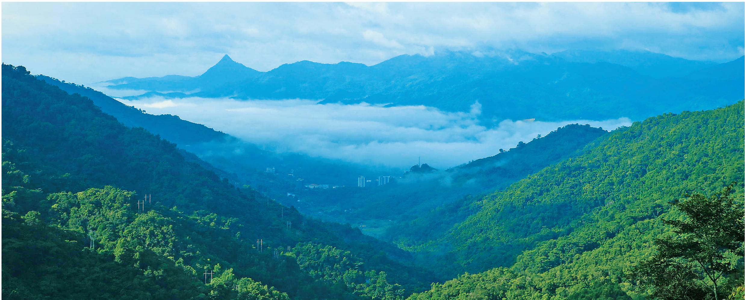
五指山市是我省的生态核心区,多条河流发源地。图为五指山的热带雨林美景。