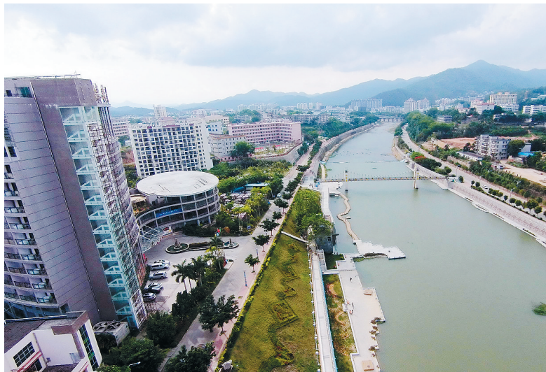
“十二五”期间是五指山市投资规模最大的时期,图为流经五指山市区的南圣河,两岸已建好的亲水平台及形象绿地。