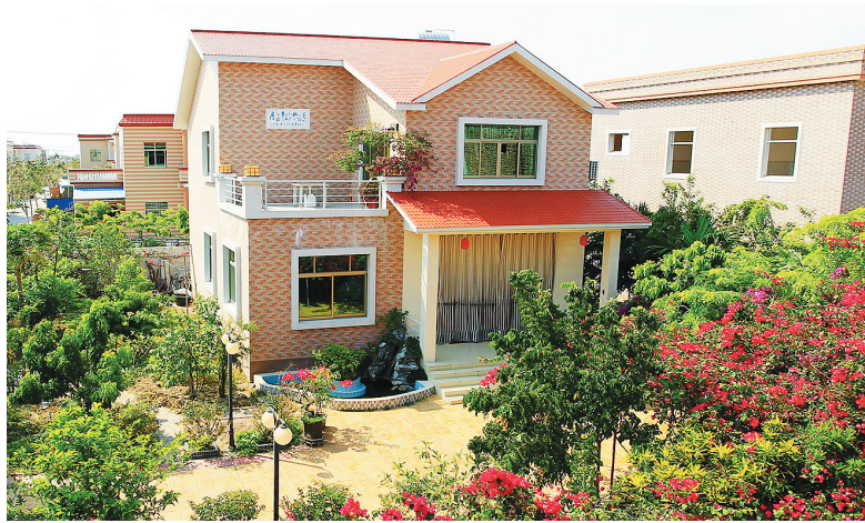
乐东坚持小财政办大民生,大力改善农村居民生活环境。图为乐东佛罗镇丰塘村的一户民居,小别墅前花团锦簇。

新黄流中学项目:概算总投资近7亿元,按照“高质量、高品位、标准化、规范化”目标进行打算,办学规模预计至少达到8000人。未来新黄流中学将有力地促进乐东中学教育水平,成为提升百姓教育自信、重振教育雄风的一面旗帜。