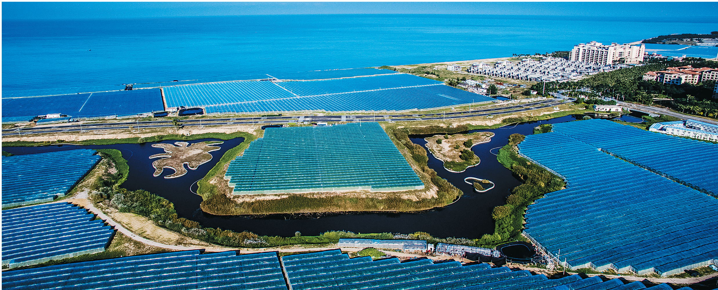
以大棚哈密瓜、热带花卉为主的现代设施农业在乐东发展迅猛。图为乐东佛罗镇龙沐湾蓝色大棚与蓝天海水融为一体。本报记者 李幸璜 特约记者 孙体雄 摄