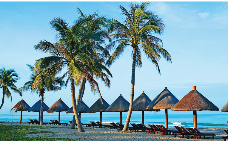
龙沐湾、龙栖湾等区域旅游房产项目进入实质性开发建设阶段,为乐东建设国际一流的休闲旅游目的地奠定了基础。图为风景如画的龙沐湾吸引游客前来观赏、游玩。本报记者 张茂 摄

据乐东县政府2016年1月初预计,2015年乐东全县生产总值是2010年的1.8倍,城镇居民和农村居民收入分别是“十一五”末期的1.8倍和2.2倍。一批批项目在上马,一处处生机在显现。回首过往可以发现,“十二五”,是乐东基础环境改善明显的5年,是特色优势产业发展具有开创性的5年,是群众生活水平提高显著的5年,也是城乡面貌变化巨大的5年。