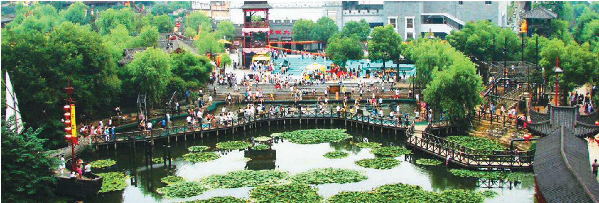
浙江省杭州西湖风景区西南的宋城,是中国人气最旺的主题公园之一。