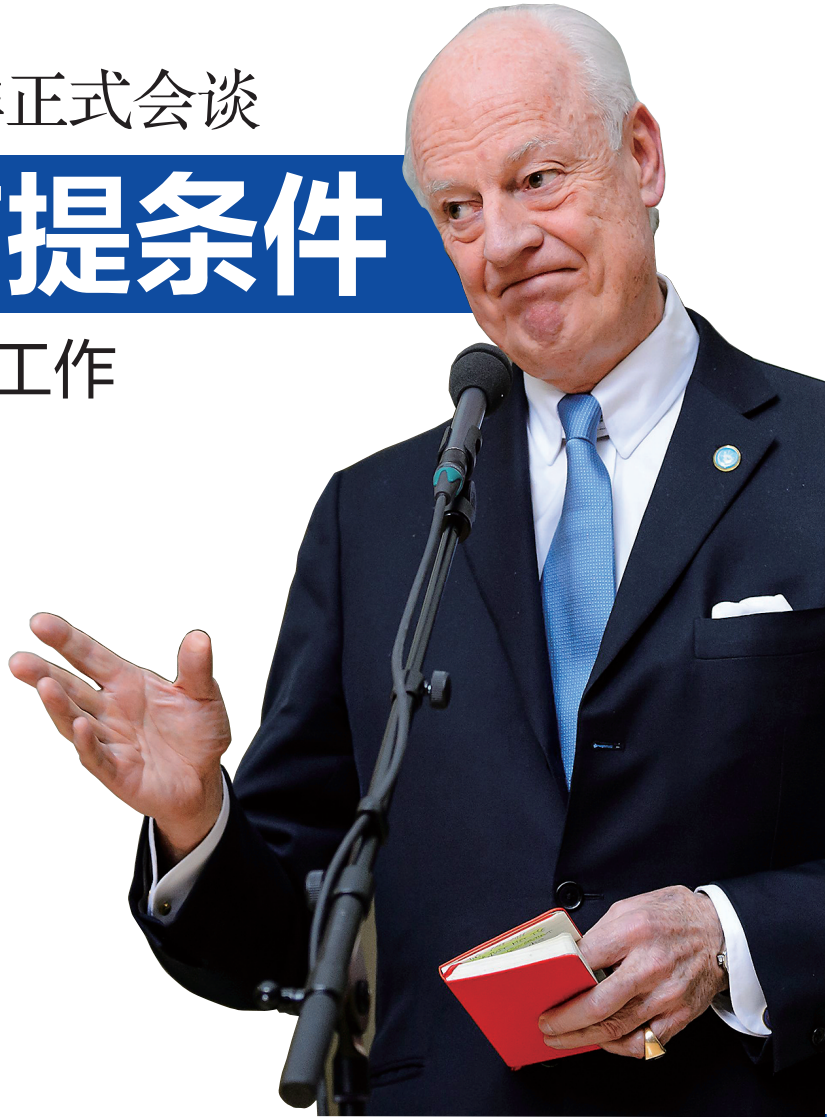
↑1月29日，在瑞士日内瓦万国宫，联合国秘书长叙利亚问题特使德米斯图拉在与叙利亚政府代表团会谈后对媒体发表讲话。

新一轮叙利亚和谈原定于25日在瑞士日内瓦举行，后被推迟至29日。此轮和谈最终能否顺利举行并达成和平协议备受国际社会关注。 分析人士认为，两年前日内瓦和谈失败的阴影犹在，本轮和谈会否取得成果尚未可知。但与两年前相比，叙利亚局势和国际形势已发生一系列重要变化，为新一轮和谈的召开和取得成功创造了一定条件。