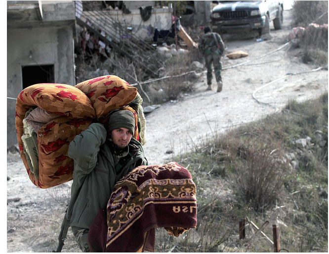
↑1月27日，在叙利亚拉塔基亚省北郊拉比耶镇，一名政府军士兵搬运御寒物资。