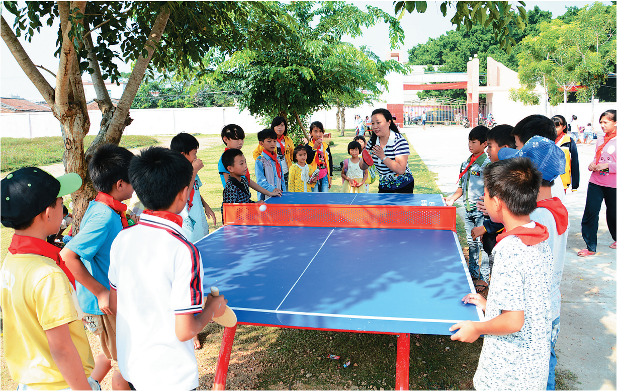
2015年10月23日,海南省乡村教育发展促进会举行“秋的喜悦”金秋助学活动,图为爱心人士与孩子们玩乒乓球。

据了解,海南省乡村教育发展促进会2015年共委派志愿者支教老师13人,分赴海口东山中心小学、临高带笏希望小学、东方板桥镇本廉小学、屯昌