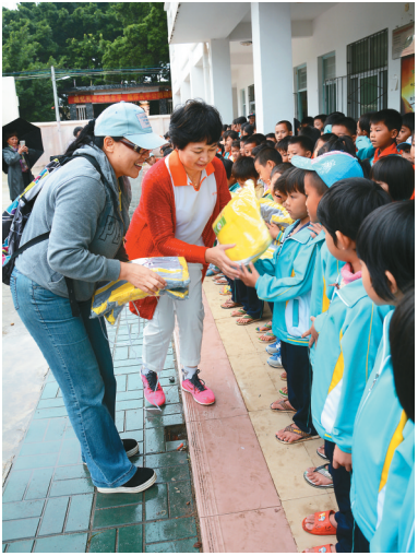
海南省乡村教育发展促进会将众筹的爱心校服和爱心鞋子送给乡村孩子。

2016年1月23日,记者在海南省乡村教育发展促进会的年会上获悉,海南火车头物流有限公司每年最少资助两位老师的生活补贴,“虽然我们公司资金不充裕,时间也不充裕,但我们希望为海南乡村教育贡献一份微薄之力。”公司负责人表示。在当天的年会上,有众多企业和爱心人士与海南省乡村教育发展促进会签署了长期的捐赠协议,