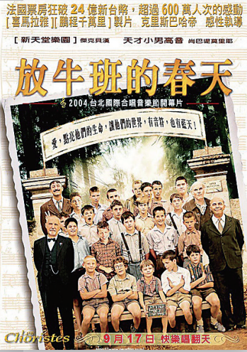
《放牛班的春天》电影海报

正值寒假，也是广大师生休息和充电的日子，本期起教育周刊推出《电影长河里的“教育艺术”》栏目，将不定期向大家推介优秀教育电影。欢迎读者分享感受。