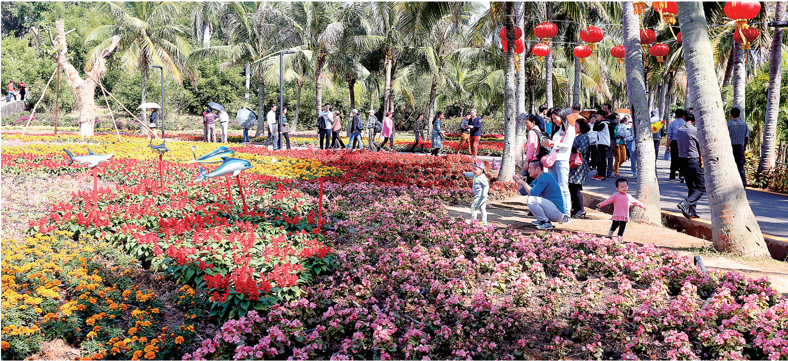
春节期间,2016首届海南国际旅游岛三角梅花展在海口开展,成为海口春节旅游的一大亮点。图为滨海公园里,游园赏花的游客络绎不绝。

在儋州东坡书院、八一石花水洞、海南热带植物园等景区,一拨拨游客接踵而至,门票网点服务人员忙个不停。儋州市旅游局有关负责人分析,多重因素使儋州及至海南西部游成为我省今年春节黄金周出游的新热点:环岛高铁西线拉近了儋州与全省各地的距离;近年来儋州修通了多条旅游公路打下了较好的条件;连续晴朗的天气便于游客出行;儋州有山河湖海森林等风光旖旎的自然景观和上千年的人文底蕴,持续吸引省内外游客。