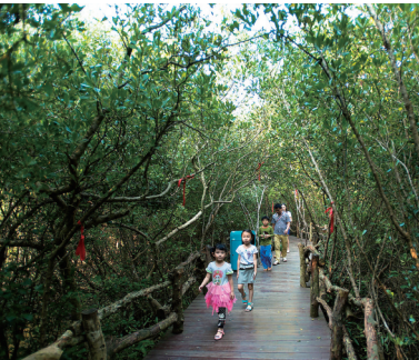
游客漫步在澄迈红树湾湿地公园内。

为做足春节旅游文章,澄迈县向省内外推介了县域内11条旅游线路,有以永庆寺和金山文化公园为代表的佛教文化之旅,以石石矸村、罗驿村、龙吉村等村落为主的古村探秘之旅等。