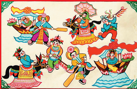
元宵民间艺人的表演

状或者牡丹状的灯碗，一种是用铁枝串起来的“火杨梅”。火杨梅是将干枣磨粉、捣炭为屑，将枣粉、炭屑拌在一起，浇上油蜡，团成圆球，一一串到铁树上，点着了，放在头顶，跟着主人上街。