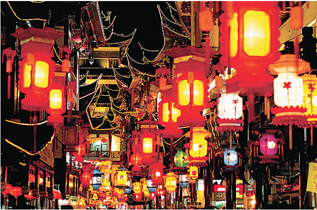
元宵看花灯是自古便有的习俗

再其次，开封府颇为重视杀鸡儆猴的作用。据《东京梦华录》记载，潘楼街展出棘盆灯的时候，“开封尹弹压幕次，罗列罪人满前，时复决遣，以警愚民。”在人群里搜出窃人钱财的小偷和调戏妇女流氓，当即拉到灯棚前示众，或打板子，或处徒刑，让那些蠢蠢欲动的坏蛋知道刑罚的厉害和做恶的后果，从而悬崖勒马，不敢再为非作歹。固