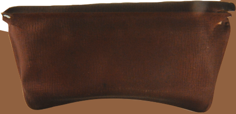
20世纪50年代冯白驹用的眼镜、镜盒