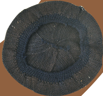
1961年冯白驹的毛线帽