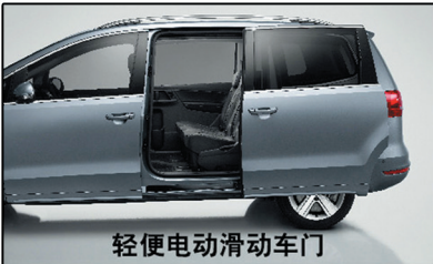
轻便电动滑动车门