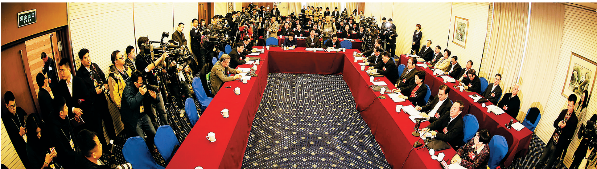
3月4日，全国政协第十二届四次会议举行小组会议。