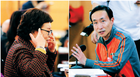
3月4日，全国政协十二届四次会议举行小组讨论。政协委员巩汉林（右）提问。政协委员刘兰芳（左）回应。