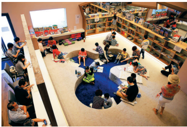
父母孩子一同在知和行书局悠闲阅读。

新型阅读空间让我们不禁思考，它的出现如何影响着我们的阅读？又为我们的生活与城市带来了什么？