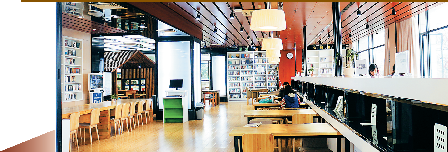
省图书馆新打造的新型阅读空间。