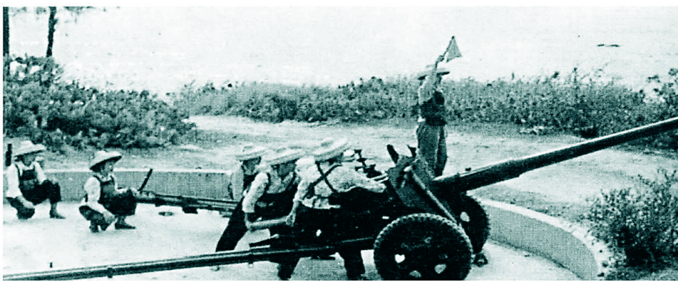
八姐妹炮班在进行85加农炮操作训练。