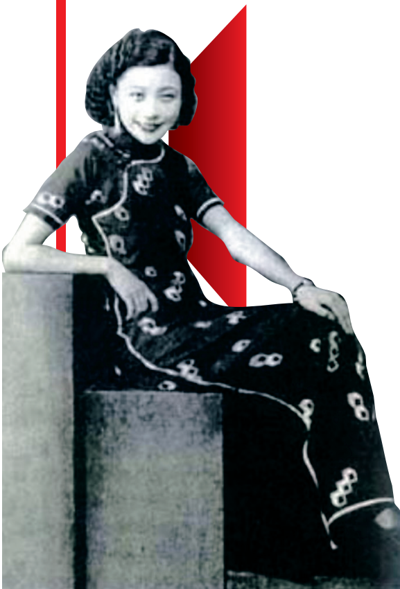
民国电影明星阮玲玉。