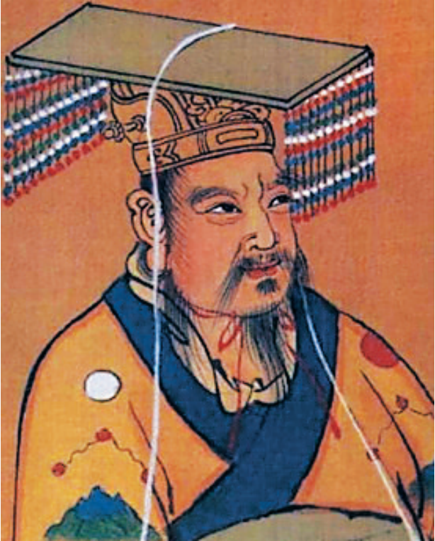
刘贺画像

一切诚如此前的猜测和推断,江西南昌西汉海昏侯墓的墓主确实是只当了27天皇帝的汉武帝之庶出孙子刘贺。 在立嫡不立长、立嫡不立庶的封建年代,非嫡又非长的刘贺为何能一度登上帝位? 他的经历又折射了汉代我国分封制度的哪些利弊和细节? 从史料记载和此次的出土文物,后人看到的刘贺,又是怎样的一个皇帝? 海南周刊特别邀约文史专家加以解读。