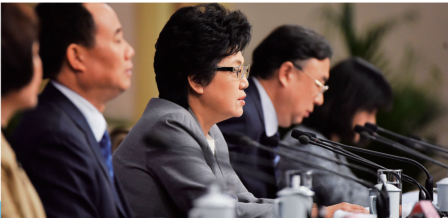
3月8日，十二届全国人大四次会议新闻中心举行记者会，邀请国家卫生和计划生育委员会主任李斌、副主任马晓伟和副主任王培安就“实施全面两孩政策”的相关问题回答中外记者的提问。这是李斌回答记者提问。

实施全面两孩政策后，进展情况如何？儿科医生紧缺怎么办？分级诊疗怎么推进？……8日在梅地亚中心举行的十二届全国人大四次会议记者会上，国家卫生和计划生育委员会主任李斌，副主任马晓伟、王培安回答了中外记者提出的一系列热点问题。