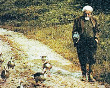
洛伦茨与他所研究的灰雁在散步