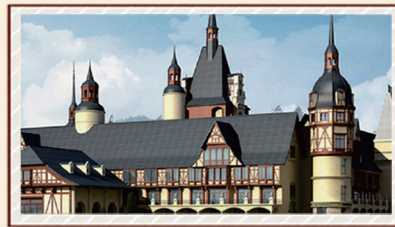
约60700m 2 六国风情酒店

恒大地产集团 EVERGRANDE REAL ESTATE GROUP 香港联合交易所股票代码：3333