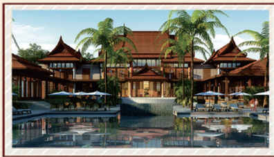
约16500m 2 五国特色温泉馆