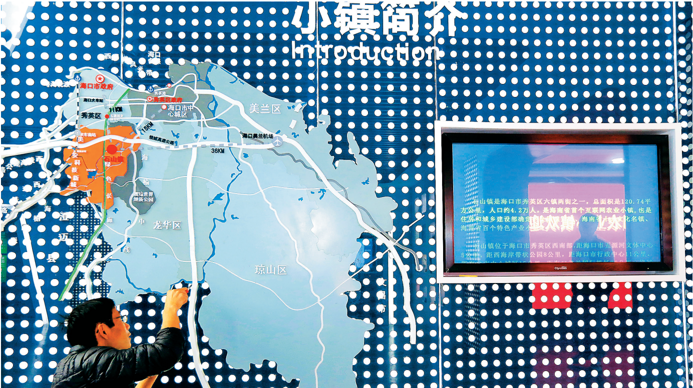
海口石山互联网农业小镇运营中心展示墙。互联网+创业创新示范基地,是该镇重点打造的目标。