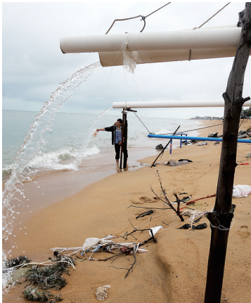
2015年7月29日,省第六海岸带保护开发专项检查组在昌江展开检查工作。图为工作人员在向大海排放污水的管道口提取水样。