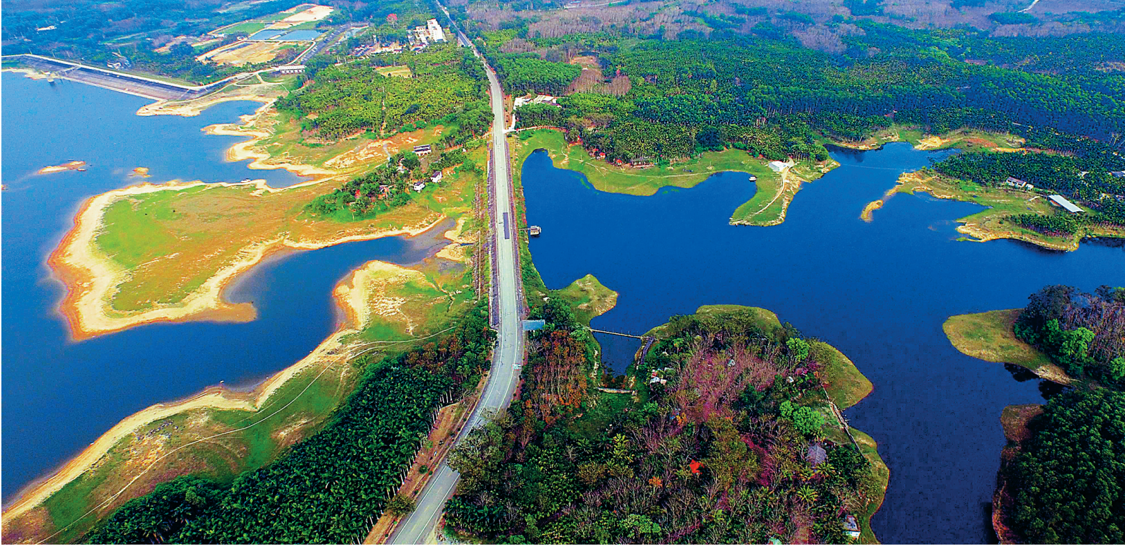
屯昌木色湖休闲旅游度假风景区,宽阔的湖面碧波荡漾。

在去年环境空气质量的公布结果中,海南的优良天数达到97.9%,海口市在全国74个考核的重点城市空气质量继续保持第一名。“海南的空气真的能醉人。”有人笑言,这么好的空气甚至可以装罐出售。 但一流的空气质量靠的不仅仅是天赐,一直以来,我省坚持“生态立省,环境优先”的理念,悉心呵护优良的生态环境,让山水林湖田整个“生命共同体”互动无间、健康循环。面对特殊的省情,海南不要黑色GDP,而是要绿色经济,要走一条低碳、绿色、可持续的发展之路。 擦亮生态名片,海南正在绿色崛起。