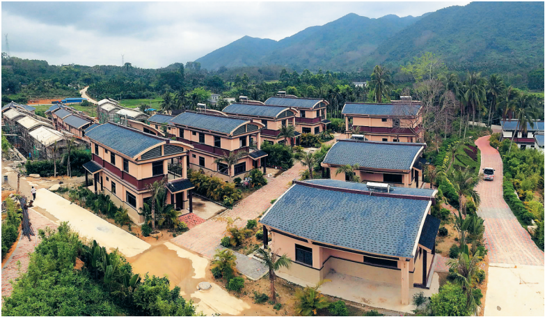
保亭黎族苗族自治县六弓乡田圪村村貌。

绍,我省将进一步提高产业环境门槛,制订符合海南特点的行业环境准入标准,从决策源头控制落后产能和防止环境污染。通过规划环评优化产业布局和结构升级,以区域限批、负面清单为手段,严格重点行业的环境准入,倒逼高污染企业、环保违规企业的淘汰退出。 同时,环保部门主动服务经济发展大局,促进绿色、循环、低碳发展,研究推进严于国家标准的地方标准体系建设,重点在污染行业和海南特色产业领域污染物排放地方标准的制订方面取得突破。 (本报海口3月21日讯)