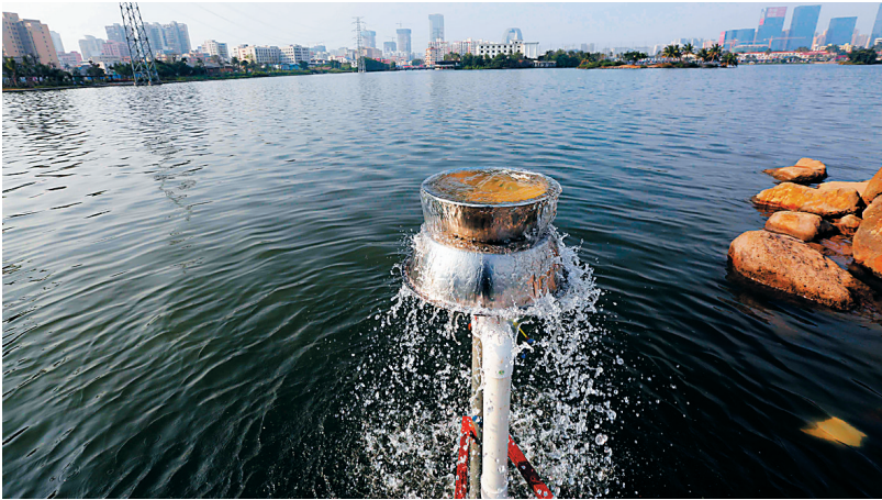
在海口市红城湖边,一个可移动污水处理厂正在将周边居民排出的生活污水进行净化处理。图为污水经净化后排入红城湖。