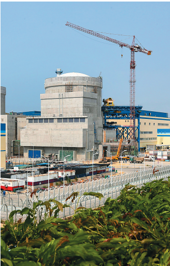
2015年3月12日，正在加紧建设中的海南昌江核电站。