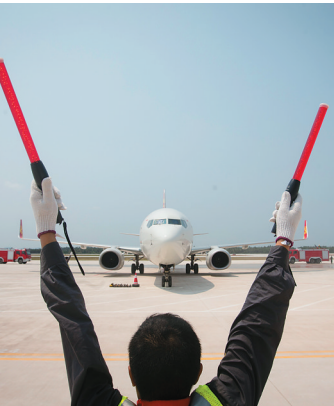
3月17日中午12时40分，由北京飞往博鳌的海南航空HU7777航班顺利降落在博鳌机场。