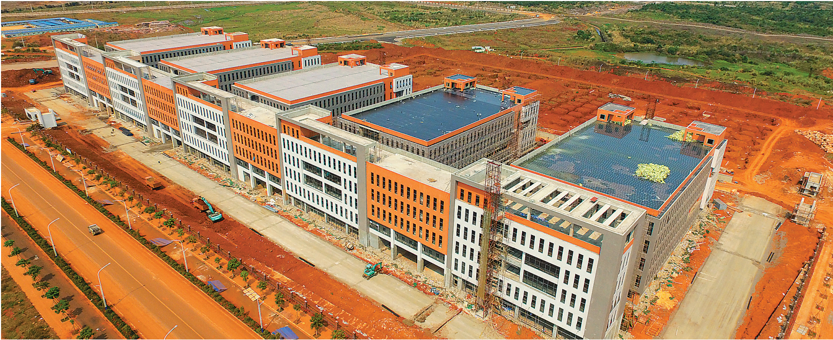
日前，我省首个专为中小创业企业服务的产业加速器在海口国家高新区美安科技新城建成。