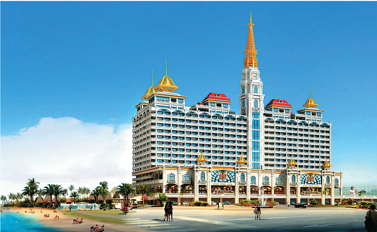
盈滨半岛金碧海岸五星级产权式国际大酒店效果图。

嘉利艺术馆现有各类珍贵的艺术品、藏品5000余件，因场馆受限，目前仅展示近千幅的字画，并免费向市民和游客开放。与此同时，中国国际书画创作交易市场也在此筹建中。