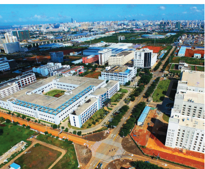
海口药谷已经成为全省医药产业发展的聚集区域。

顾刚透露,目前已经有海南医学院安评中心、中试车间等项目入驻“新药谷”产业园区,在今天召开的海南省医药产业座谈会上,签订的6个医药产业项目也将落户该产业园区。