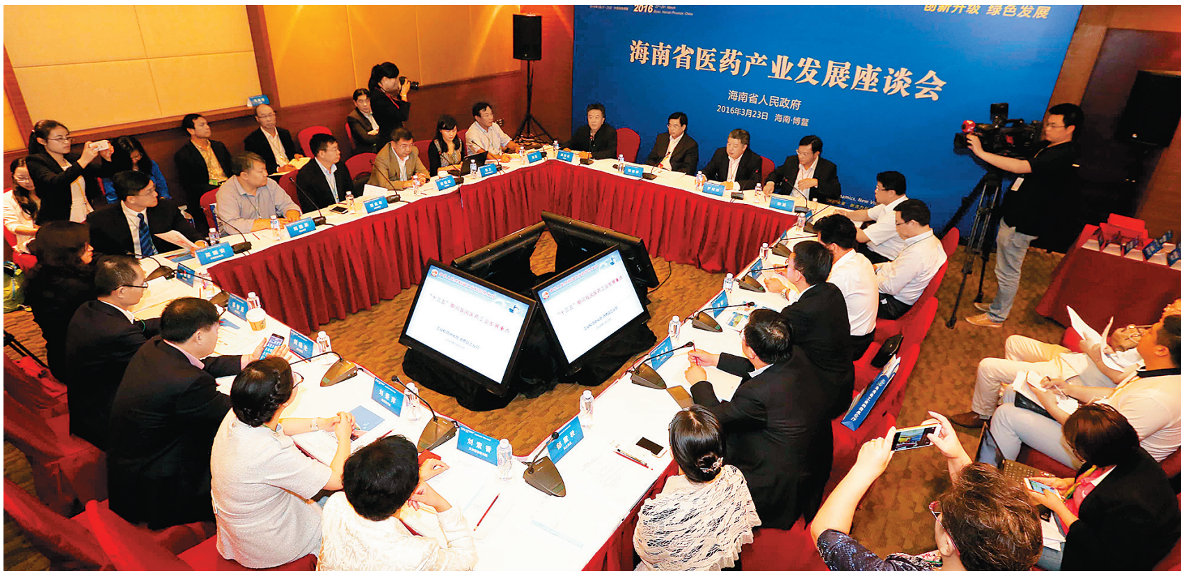
3月23日,在海南省医药产业发展座谈会上,嘉宾们为海南医药产业发展建言献策。